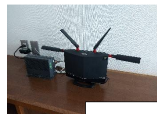
公民館で WI-FI が使えるようになりました。