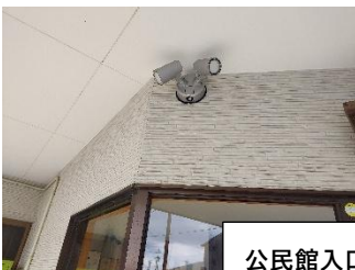
公民館入口に防犯灯を設置しました。