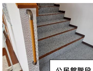
公民館階段入口に新しく手すりをつけました。